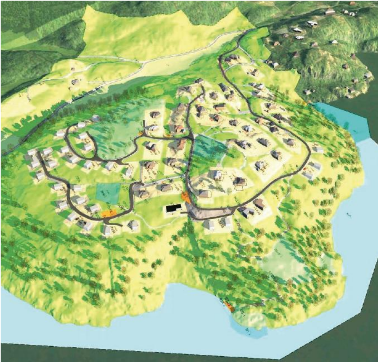
Figur 2 utsnitt planområde.